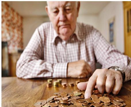
Rentner werden sich freuen, aber nicht überschwänglich.

Vor wenigen Tagen hat das Bundesarbeitsministerium bekanntgegeben, dass die Renten aus der gesetzlichen Rentenversicherung zum 1. Juli 2017 um 1,9 Prozent im Westen und um 3,59 Prozent in den neuen Ländern angehoben werden.